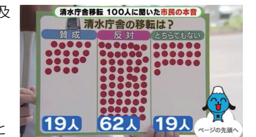
テレビ静岡のアンケート結果（10月18日放送）

テレビ静岡が100人に対し街頭で行った調査では移転について「反対」が62人、「賛成」が19人、どちらでもないが「19人」という結果でした。市民の賛同を得ているとは言い難い状況です。