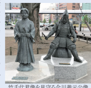
竹千代君像を見守る今川義元公像