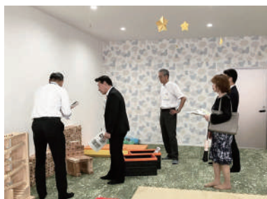
「子どもの遊び場 ビバしみず」現地監査