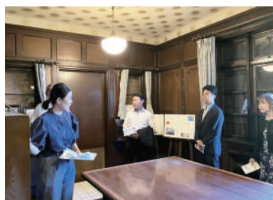
駿河区の「マッケンジー邸」現地監査