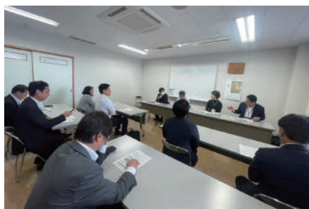
「教育支援センターふれあい教室」を視察 不登校支援の現状を調査