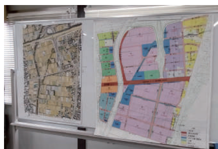
現在整備中の「宮川水上まちづくり」に ついて視察