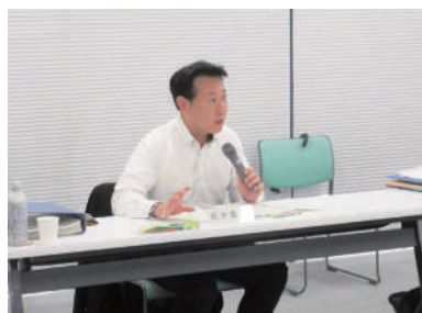
事業が適正に行われているか等について質問