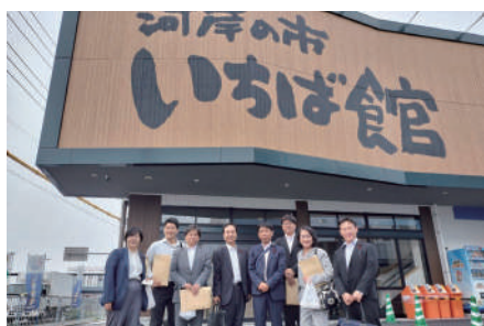
今年4月にリニューアルオープンした「河 岸の市いちば館」を視察