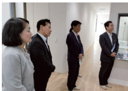
今年4月に新築移転した「環境保健研 究所」を視察