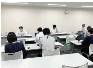
実際の監査の様子

4月臨時議会で選出され、今年度「監査委員」を務めています。静岡市の事業を次のような観点からチェックするのが監査委員の仕事です。