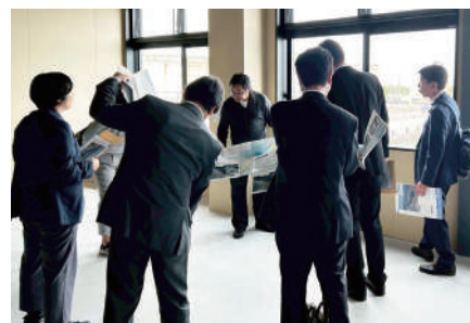
JR清水駅近く（江尻）に整備された 「新駿河湾フェリーターミナル」を視察