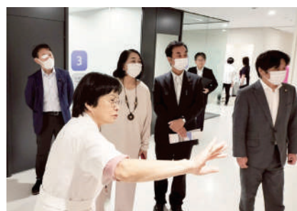
今年3月にオープンした 「JCHO清水さくら病院」を視察